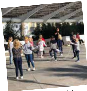
Dagen ble avsluttet med slengtau, ballspill, lek og tegning.