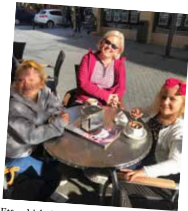
Etter kirkebesøk og lekepause var det på tide med litt varm sjokolade og churros på kafé. Litt søtt for noen, men ganske så godt for de aller fleste.