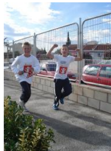
Flott driv i løypa!

Totalt ble det samlet inn 294 Euro. Et kjempemessig resultat. Vel gjennomført skolejogg alle sammen.