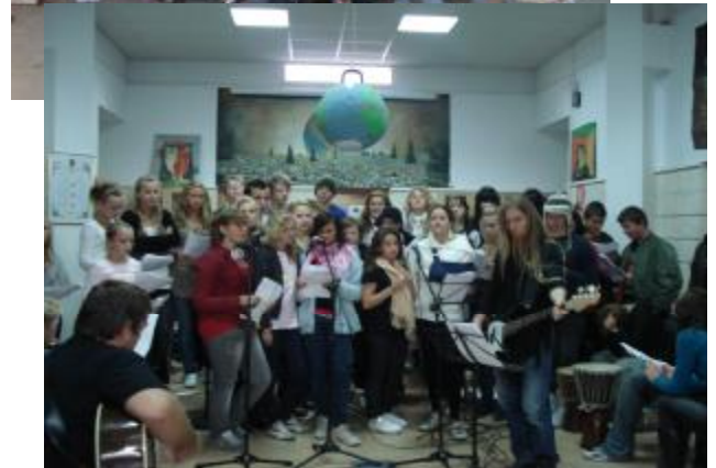
Felles samling med DNS fra Albir = fullt trøkk!