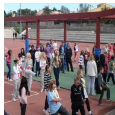
Oppvarming er viktig.