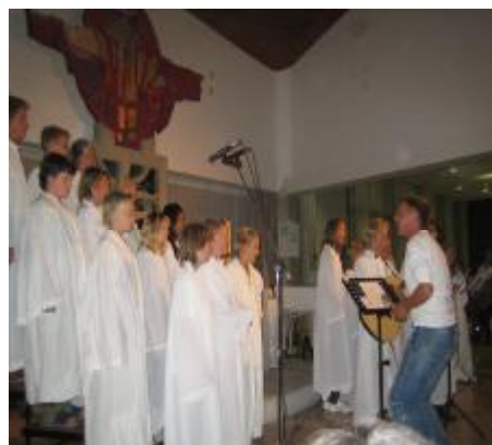
6.og 7.klasse i aksjon.

Onsdag 26.11 var det lysmesse i Sjømannskirka i Torrevieja. Skolen var hjertelig til stede og fylte opp kirken sammen med mange ivrige tilhørere. 6. og 7. klasse ved DNSR stod i år for en flott inngang med tente lys, noe som var svært stemningsfullt. I løpet av messen bidro elevene med tekstlesing, tenning av lys og et flott sangnummer: "Himlen i din favn".